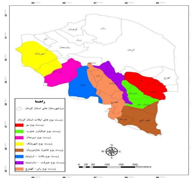
شکل ۱- نقشه زیست بوم‌های عشایر استان کرمان

بین روستاییان می‌گردد. طبیعتاً تولید بیشتر، افزایش بهره‌وری اقتصادی را برای روستاییان (و حتی شهرنشینان) در پی خواهد داشت. مطیعی لنگرودی و همکاران (۲۰۱۱) به بررسی نقش بازارهای دوره‌ای محلی در توسعه اقتصادی - اجتماعی روستاهای استان گیلان پرداختند. نتایج تحقیق آنها حاکی از آن است که بازارهای دوره‌ای محلی در ابعاد اقتصادی، اجتماعی و فرهنگی اثر مثبتی بر توسعه روستاهای مورد مطالعه استان گیلان داشته‌اند. دلیل این امر آن است که در بعد اقتصادی سه مؤلفه، در بعد اجتماعی و فرهنگی دو مؤلفه در بازارهای دوره‌ای وجود دارند که بر توسعه روستایی اثر گذارند و عامل توسعه اقتصادی و اجتماعی در نواحی روستایی مناطق مورد مطالعه می‌شوند. واقعیت آن است که برای ایجاد و دستیابی خانوارهای عشایری به یک معاش پایدار، می‌بایست در ابتدا وضعیت موجود مورد مطالعه و بررسی دقیق قرار گیرد و در این بررسی باید نقطه نظرات و دیدگاه‌های سرپرستان این خانوارها و کارشناسان لحاظ گردد. از سوی دیگر سازه‌هایی که قادرند در معیشت خانوارهای عشایری و در پایداری آن تأثیرگذار باشند، باید شناسایی و مورد مطالعه قرار گیرد. یکی از عواملی که می‌تواند به معیشت پایدار عشایر کمک شایانی کند تشکیل و توسعه بازارهای محلی جهت عرضه